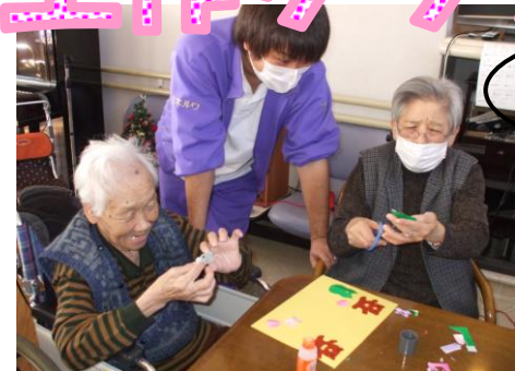
ちょっと切るのが