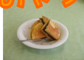
手作りドラ焼き 美味しいよ