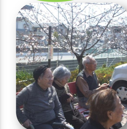
通所の皆さんも桜をバックに撮影会です