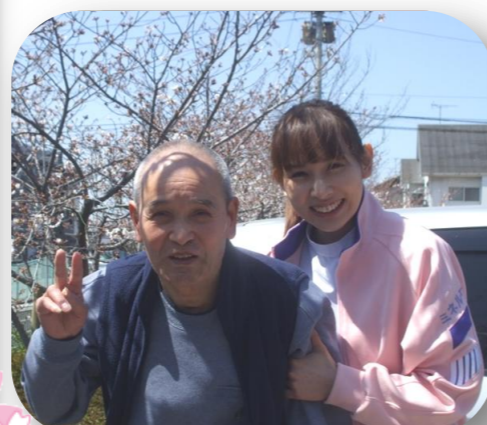
花に囲まれリハビリも笑顔で♪