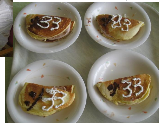
ココアクリームたっぷりでウマウマです

5月の手作りおやつは、こいのぼりに因んで、お魚のホットケーキでした。「33」のうろこ模様がかわいいですね♡