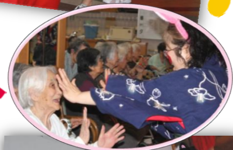
演奏も頑張りました！

最後に赤いほっぺをつけた職員が今風にアレンジされたアップテンポの「おてもやん」を踊り始めると、利用者様も何名か飛び入り参加されて大盛り上がりの行事となりました。