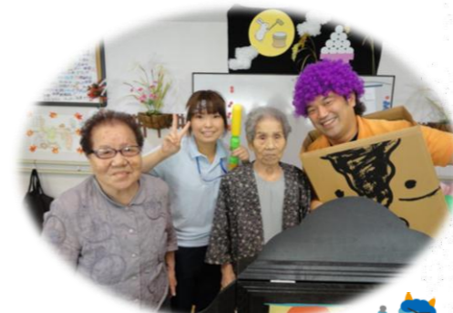
最後は仲良く記念撮影♪