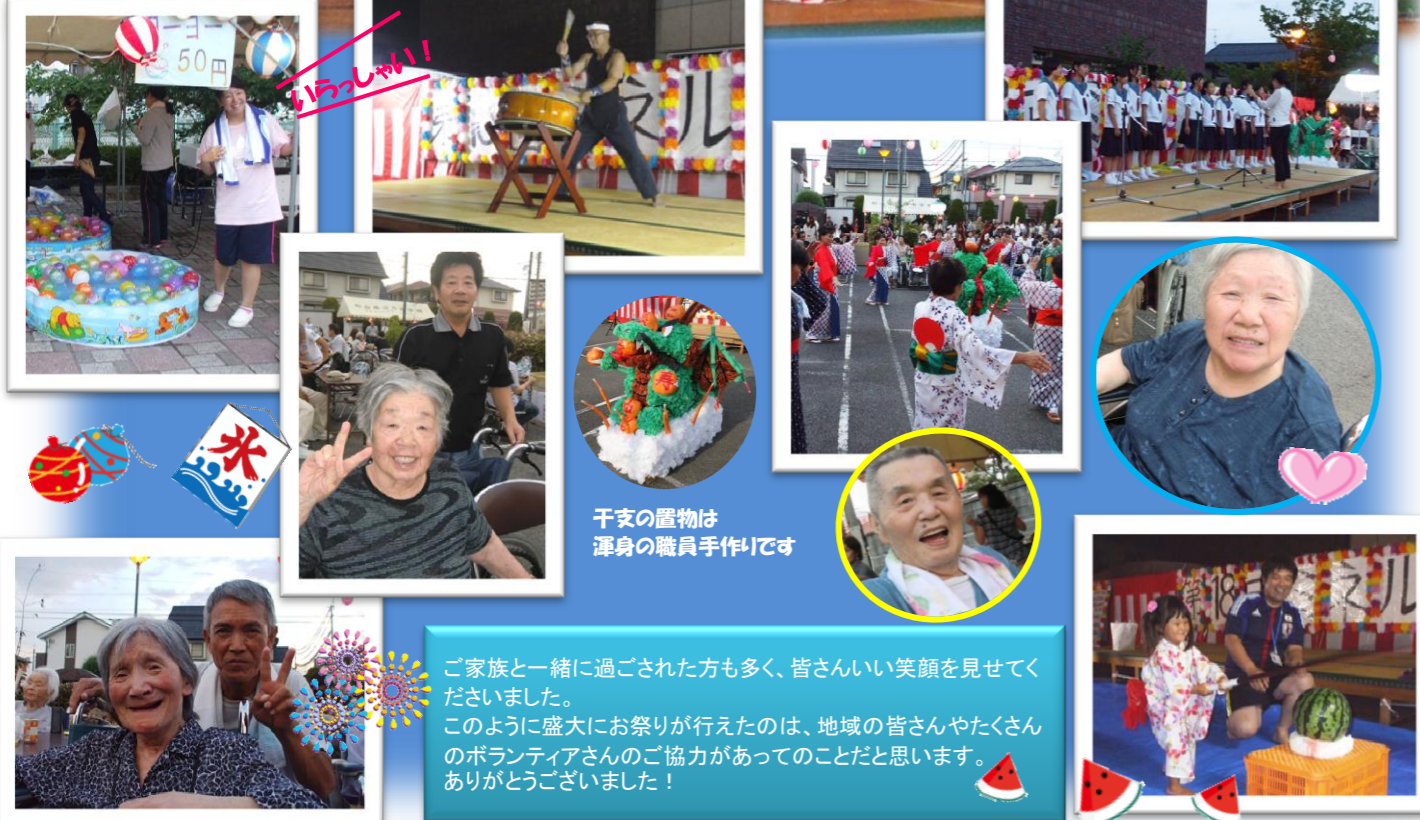
千支の置物は 渾身の職員手作りです

ご家族と一緒に過ごされた方も多く、皆さんいい笑顔を見せてくださいました。 このように盛大にお祭りが行えたのは、地域の皆さんやたくさんのボランティアさんのご協力があったことだと思います。 ありがとうございました!